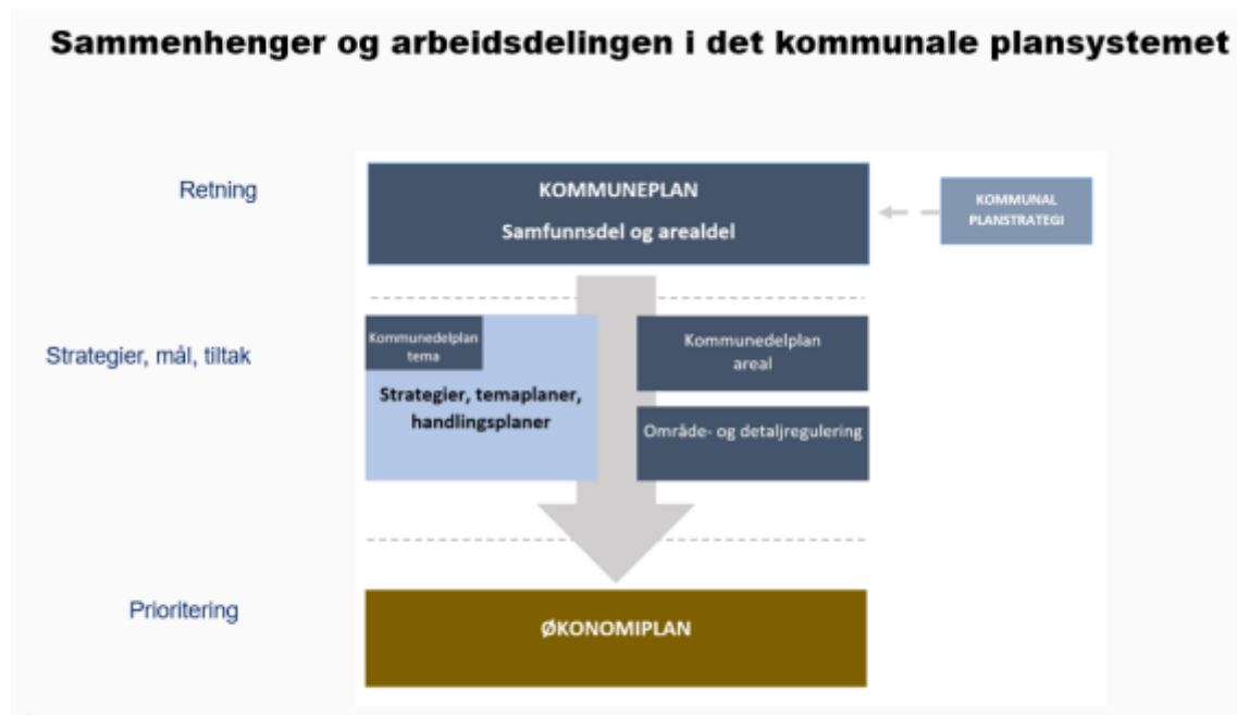
Sammenheng og arbeidsdeling i det kommunale plansystemet. Illustrasjon: Asplan Viak

Som Asplan Viak har illustrert skal Kommuneplanen gi oss en retning mens fag- og temaplaner skal gi oss strategier, mål og tiltak for at vi i økonomiplanen kan prioritere.